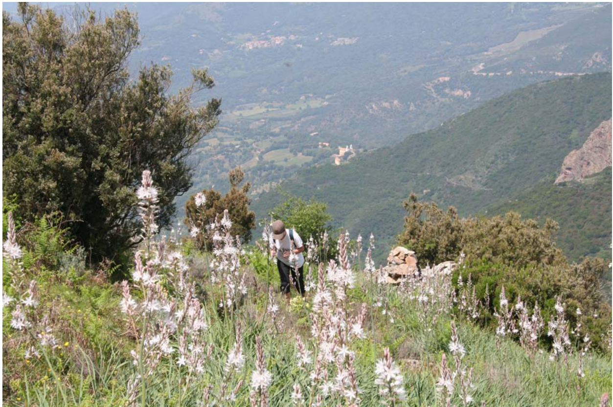
Au-dessus de la Bocca de Bufanaggia, au milieu des asphodèles, vue sur Santa Reparata et l'Eglise de Sari d'Orcino, 600 m plus bas.

6 – Liaisons possibles vers Appietto par le col de Sarzoggiu, Lopigna par le col de Vergio, Arro par la Punta di a Vida.